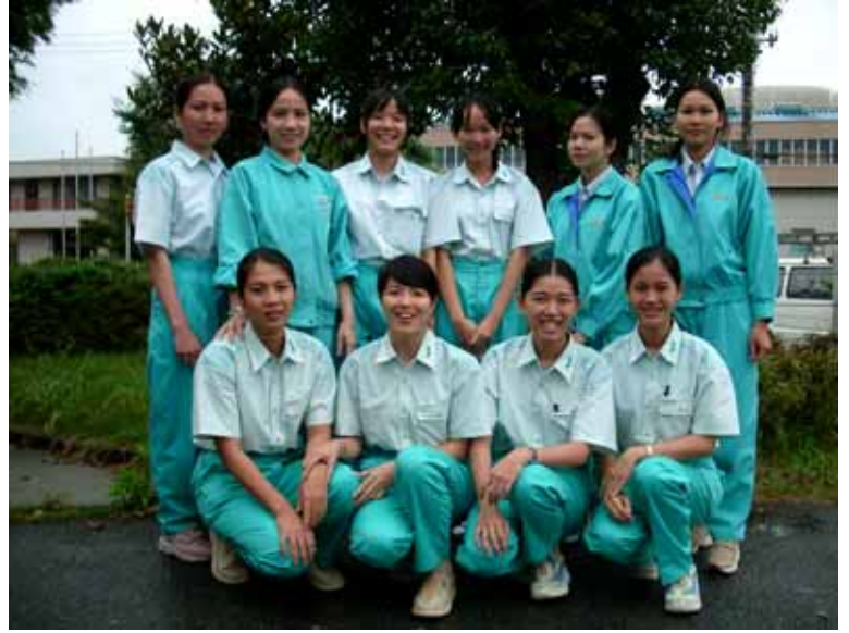
羽生事業所のベトナム研修生たち

当社・羽生事業所は昨年度7月より「外国人技能研修生制度」に取り組み始め、現在1期生6名、2期生4名の計10名のベトナム人が活躍しています。この制度は、外国人を日本へ招聘し、1年間の工場内研修、その後2年間の実務実習、計3年間働いてもらう制度です。勤勉さ、手先の器用さで日本人に勝るとも劣らないとされるベトナム人は技能取得という目的で来日しているため非常に勤労意欲が高く率先して仕事をします。そして最近の日本人が忘れがちである家族の絆も大切にします。言葉の問題はありますが日本語の修得にも熱心で同僚の日本人従業員に溶け込み貴重な戦力として貢献しています。