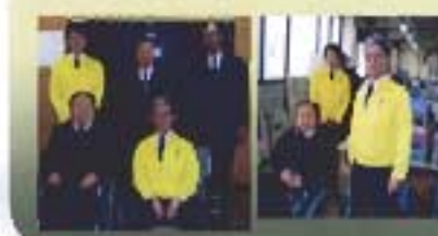
ファナックマグトロニクス㈱