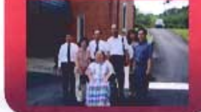
㈱富士コスモサイエンス