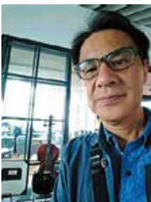
バイオリンの名器 ストラディヴァリウスと一緒に

2020年には東京オリピックが開催されますが、セブンヒルズも会社設立五十周年を迎えます。その前年の今年は、非常に大きな意味を持つ一年であると認識しております。会社設立から半世紀を迎えるということは、先人たちの知恵が代々伝えられてきたためだと思います。自分は次の半世紀へのバトンを確実に繋ぐため、今年が飛躍の年にしたいと思えます。仕事もプライベートも全力投入！ 有志有道！