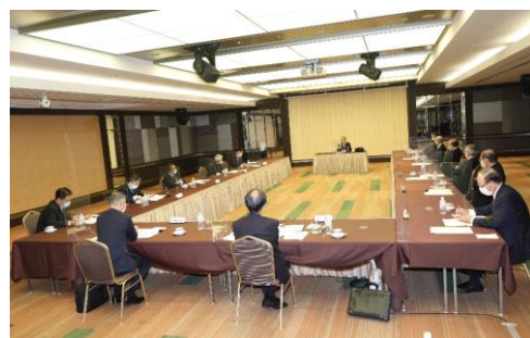
社長会勉強会の様子